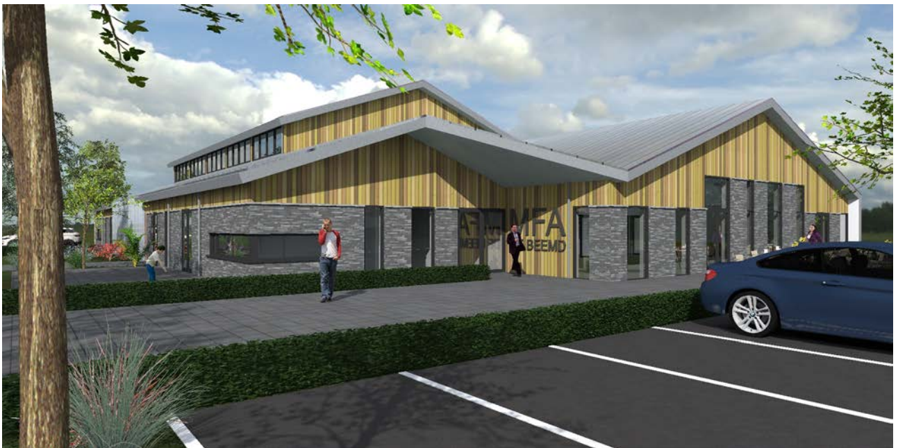
Afbeelding van nieuwbouw Dorps huis De Beemd in Oud-Alblas

U kunt investeren in één of meer certificaten die 330 euro per stuk all-in kosten. Per certificaat wordt één zonnepaneel gefinancierd. In totaal worden er maximaal 300 panelen geplaatst. De stroom die uw paneel oplevert wordt geleverd aan Duurzame Energie Unie. U krijgt op basis van de huidige belastingregeling* ruim 12 cent per kWh korting op de energiebelasting van de door uw panelen opgewekte energie. Dit voordeel wordt verrekend met uw elektriciteitsrekening.